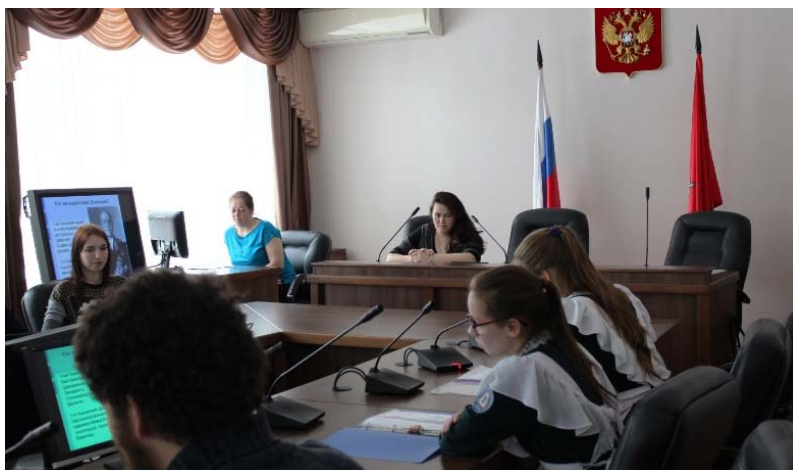
Круглый стол во Владимире, посвященный Дню памяти жертв Холокоста

В рамках реализации проекта «Страницы судеб» Центром «Холокост» были переданы архивные документы и фотографии школьным и вузовским музеям. На основе этих документов состоялись выставки «Холокост: уничтожение, спасение, освобождение» и «Страницы судеб» в образовательных организациях и музеях Рес-