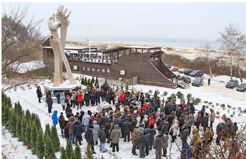
«Марш жизни» в Калининградской области