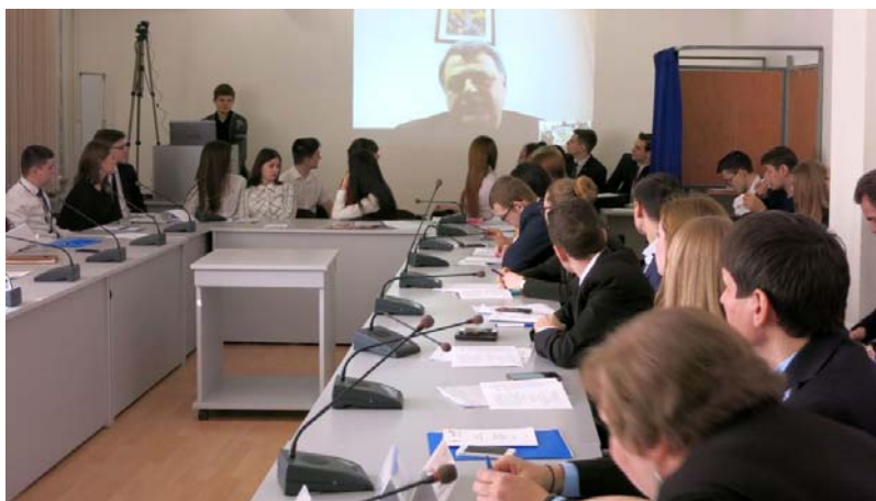
Открытие конференции в Волгограде

21 февраля в Волгоградском государственном университете состоялась Межвузовская научная студенческая конференция «Холокост: преступление века глазами молодого поколения». С приветственными словами к участникам конференции обратились проректор по учебно-воспитательной работе