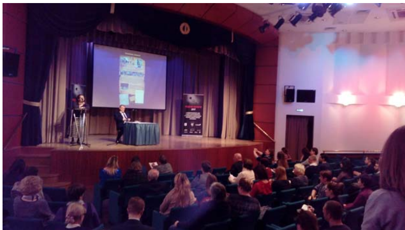
Семинар для педагогов Москвы

Первый в 2017 г. семинар Центра «Холокост» для педагогов Москвы прошёл 20 января 2017 г. в Культурном центре Главного Управления Дипломатического корпуса при МИД России. Он был посвящён подготовке к Международному дню памяти жертв Холокоста и годовщине освобождения Красной армией узников Аушвица (Освенцима).