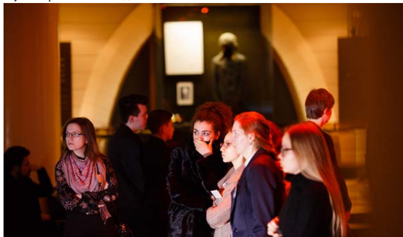
Участники конференции на осмотре экспозиции музея Холокоста и еврейского наследия на Поклонной горе