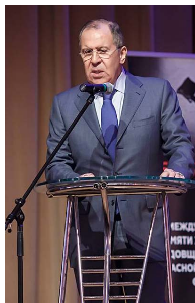
Открытие выставки в КЦ МИД, выступает С.В. Лавров

И.А. Альтман, С.В. Лавров и Ю.И. Каннер (слева направо) на открытии выставки