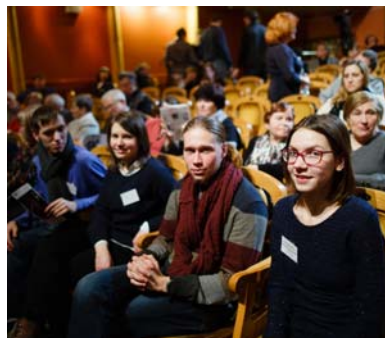
Студенты (первый ряд) на мемориальном вечере