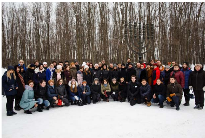
Участники конференции около синагоги на Поклонной горе

Открытие конференций состоялось в Музее еврейского наследия и Холоко-